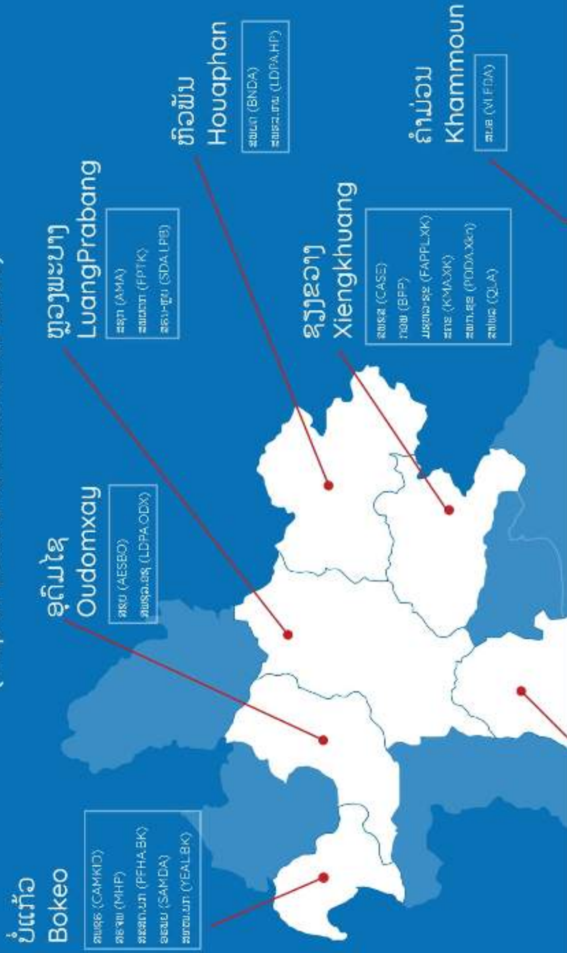
(Map of Laos and Location of CSOs)